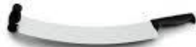
Nož za sir