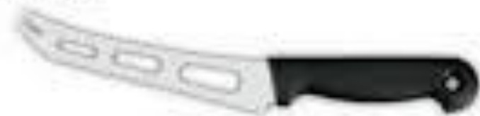
Nož za sir